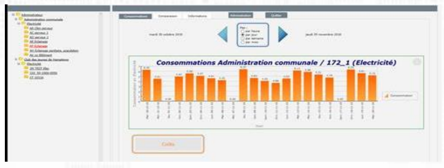
Cumul de consommations par jour